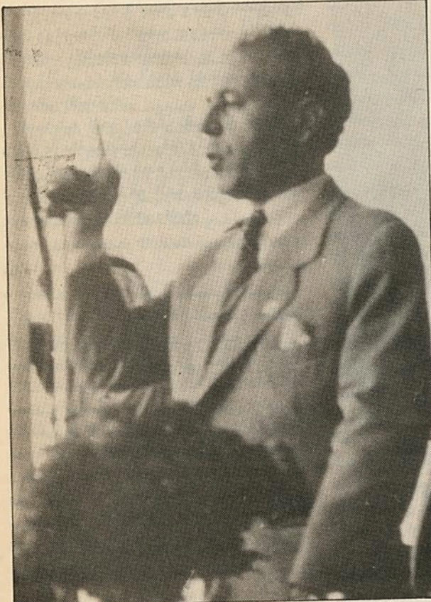
السياسة من أجل السياسة لا يمكن ان تكون عملاً قومياً

● لا يمكن أن يكون شيء اسمه قيمة إلا ان تحصل له علاقة نفسية في الإنسان